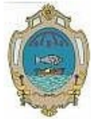
Comune di Baricella

Sottosezione “Rischi corruttivi e Trasparenza” (già P.T.P.C.T.) coordinata – Anni 2023-2025