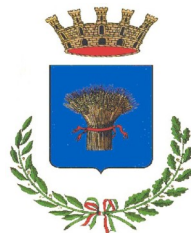
Comune di Granarolo dell'Emilia