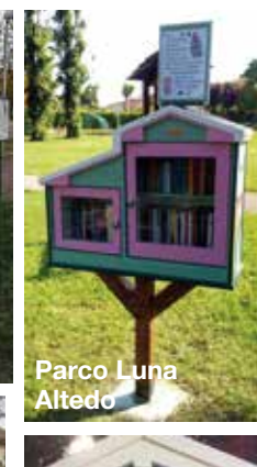
Parco Luna Altedo