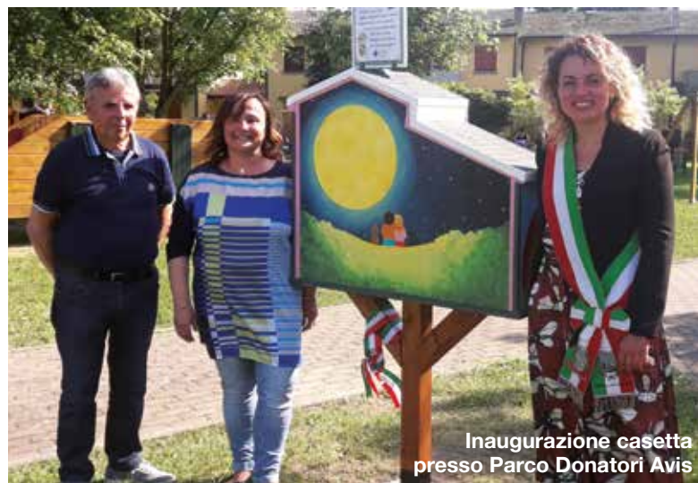
Inaugurazione casetta presso Parco Donatori Avis