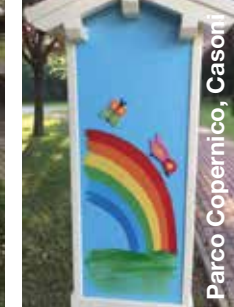
Parco Copernico, Casoni