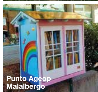
Punto Ageop Malalbergo