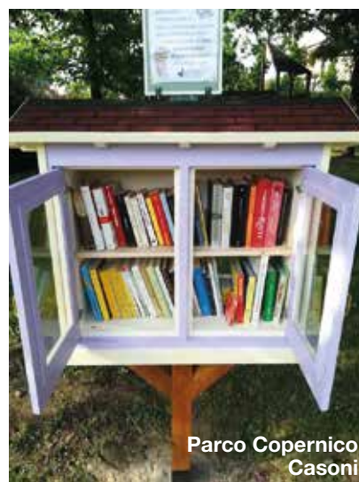
Parco Copernico Casoni

Queste casette sono un dono di gruppo di volontari che ha deciso che la cultura debba invadere il nostro territorio; leggere apre la mente. Sul tetto delle casette c'è questo messaggio: "Ciao, sono un libro libero ed ho voglia di essere letto da più gente possibile. Prendimi a casa con te, leggimi, riportami in questa casetta oppure tienimi nella tua libreria. Questa è la casa dei libri liberi, dove anche tu puoi alloggiare i tuoi, affinché altri li possano leggere".