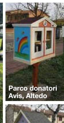
Parco donatori Avis, Altedo