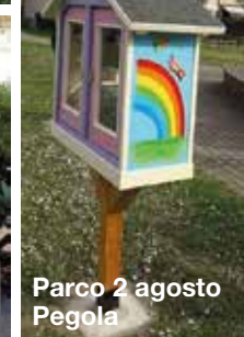
Parco 2 agosto Pegola