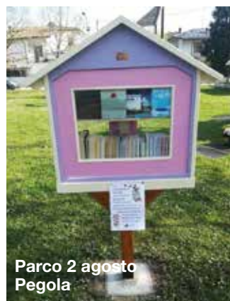
Parco 2 agosto Pegola